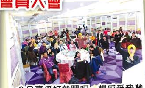
今日真係好熱鬧呀，想感受我哋嘅氣氛，下年記得要參加喇！