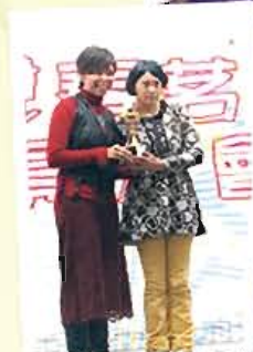
我今年都要代表中心參與‘出面’嘅比賽，下年就輪到我上喇！