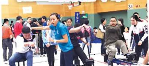
陸上划艇就見得多，原來有陸上龍舟機嘍？！