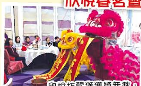
欣悅坊醒獅獲獎無數，梗係要請佢嚟助慶啦！