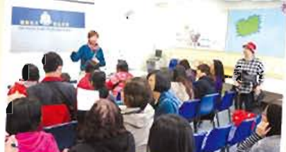
聽完阿Sir同Madam講解有關守護咭，大家平日外出記住要帶响身呀！