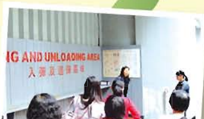
一場嚟到，順便參觀一吓警署先……