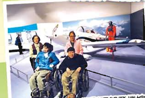
幫我哋影張相呀，要影晒架飛機嫁！