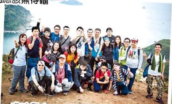
成功登山，一齊嚟擺個勝利手勢啦，Yeah……