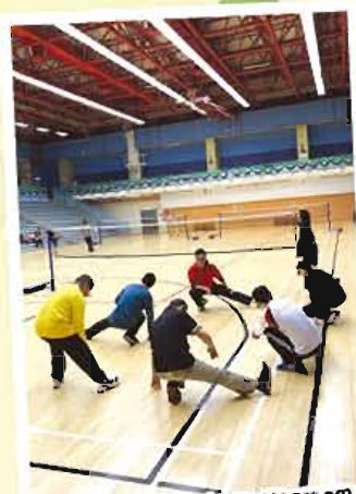
做運動前熱身是常識吧！