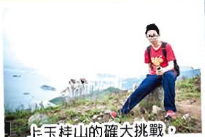
上玉桂山的確大挑戰，但係風景真係無敵