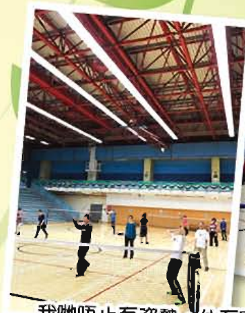
我哋唔止有姿勢，仲有實際嘍，接招……