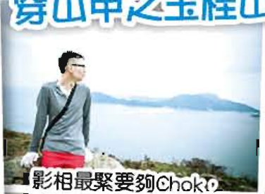
影相最緊要夠Chok，我哩個側面應該無得輸