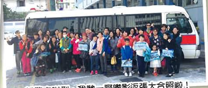
一架警車咁型，我哋一齊嚟影返張大合照啦！