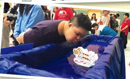
當日有好多好玩嘅遊戲呀！