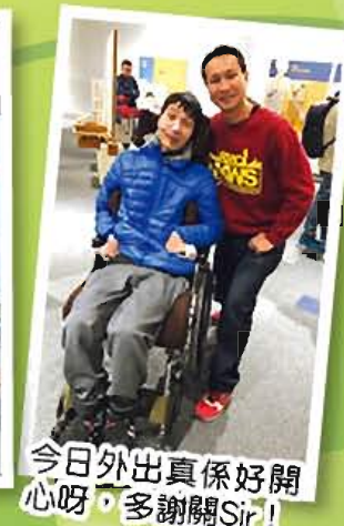
今日外出真係好開心呀，多謝關Sir！