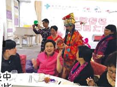
當然唔少得財神嚟到派利是啦！