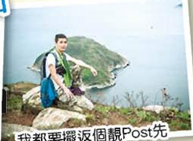
我都要擺返個靚Post先