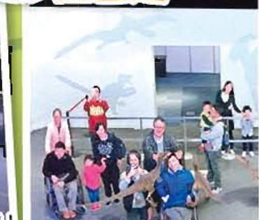
救命呀！！隻恐龍咬我呀……